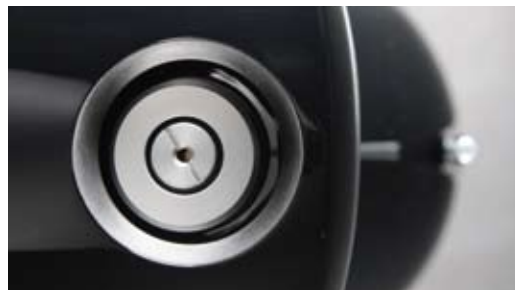
DETAIL-VERLIEBTHEIT: Die Anschlussklemmen sitzen leicht zugänglich in der Bodenplatte. Die vom Bassgehäuse entkoppelte Mitteltonkammer wird mit einer Transportsicherung auf der Rückseite gesichert.

Ring. Wie würden die begnadeten HiFi-Cracks neben den Studio-Profis aufspielen? Auf den ersten Blick brachten die 207/2 die B&Ws beinahe in die Defensive, denn die Wiedergabe besaß insgesamt mehr Kick. Dennoch konnten die KEFs schon mal nervös wirken, während die B&Ws stets britische Coolness an den Tag legten und selbst mit weniger guten Aufnahmen niemals barsch wirkten. Im Tiefbass boten sie noch mehr Substanz, und in den Höhen holten sie noch mehr Details an die Oberfläche und verliehen den abgebildeten Räumen einen Hauch mehr Luft. Einzig in den Mitten fehlte der insgesamt knapp überlegenen 800er gegenüber der impulsiven 207 etwas Leben.